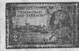
UNO DE LOS SELLOS DE NUEVA EMISION