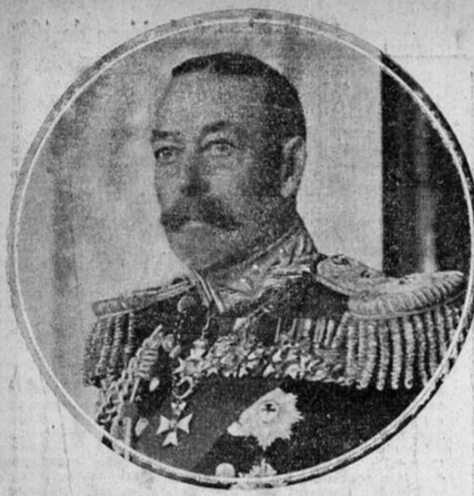
SU MAJESTAD EL REY JORGE V de la Gran Bretaña, Emperador de la India, que celebra mañana el vigésimo quinto aniversario de su