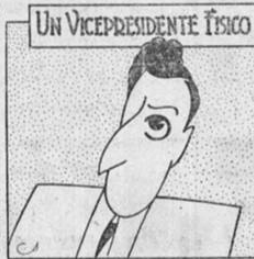
UN VICEPRESIDENTE FÍSICO