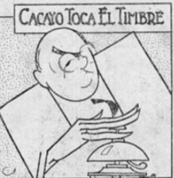
CACAYO TOCA EL TIMBRE

Cacayo toca lo que puede; eso lo sabe todo el mundo, toca el flautín, toca el tango, toca lo que se le ponga por delante. Por eso es que ahora Cacayo toca el timbre en el congreso. Ya lo vimos el primero de mayo. Cacayo les tocó el trémino a los diputados y los diputados, que to