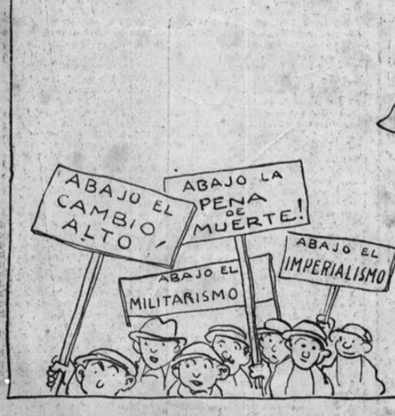
—Pero si esto es una manifestación contra la Unión Soviética! ¡Todo lo que los comunistas de aquí gritan ¡abajo! es lo que está imperando en Rusia!