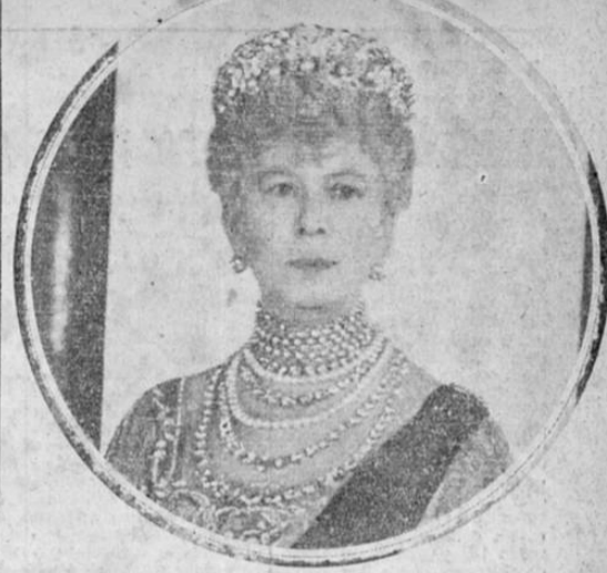
SU MAJESTAD LA REINA MARIA de la Gran Bretaña, Emperatriz de la India, quien ha acompañado al Rey Jorge en su brillante viaje durante un cuarto de siglo. Esta foto fué hecha también para ser publicada con motivo del jubileo que se celebrará mañana.